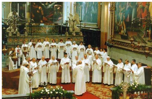
← Basilica di San Marco - Milano

↓ Abbazia cistercense di Chiaravalle - Milano